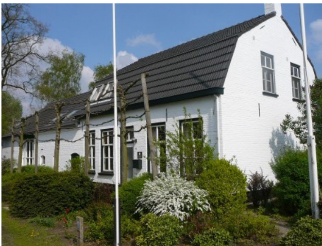
De Hooge Berkt

De gemeenschap (1967) is ontstaan uit een paar mensen die samen gastvrijheid boden aan eenieder die op zoek was naar een verbinding tussen geloof en het dagelijks leven: religieuzen, gezinnen met kinderen, alleenstaanden, enz. Het werd voor honderden tochtgenoten een plaats (een 'herberg') die je onderweg in je leven kunt aandoen, op zoek naar zingeving en bestemming. (Verdere informatie: www.hoogebekkt.nl )