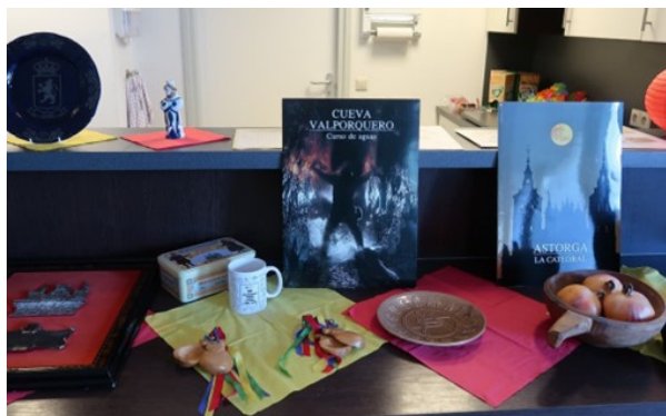
Spaanse attributen en aandenken.