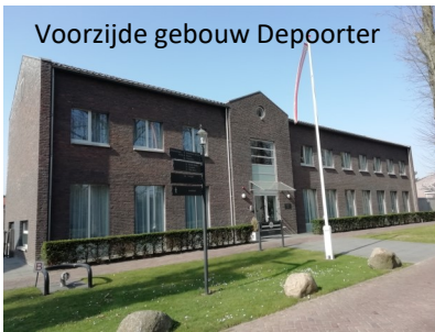
Voorzijde gebouw Depoorter

In deze nieuwe rubriek houden we u op de hoogte van wat er speelt binnen het broederhuis Depoorter in Eindhoven. Depoorter is nog het enige convent dat we in Neder-