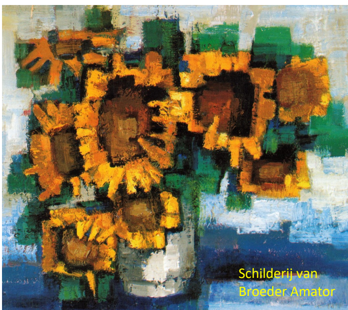
Schilderij van Broeder Amator