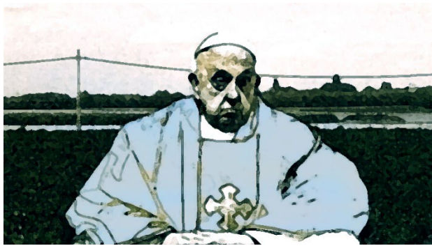
De paus koos de naam Franciscus, verwijzend naar Franciscus van Assisi, de apostel van de armen.

Toch worden er initiatieven genomen naar nieuwe werken en men gaat naar Oostenrijk, Spanje, Brazilië en Ethiopië. Om daar baanbrekend werk te doen, moeten sommige bestaande werken worden afgebouwd en