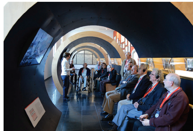
In het STAM: de broeders kijken naar historisch beeldmateriaal in de futuristisch aandoende kokers van het stedelijk museum.

We waren met 28 deelnemers op de bus: achttien broeders en tien zusters. We bezochten eerst de Gentse zeehaven en aansluitend het STAM, het Gentse stadsmuseum dat sinds oktober 2010 op de Bijlokesite het verhaal van Gent brengt.