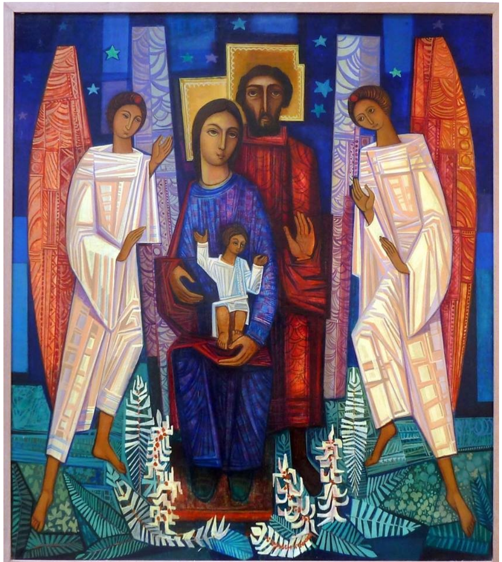
Schilderij van broeder Amator