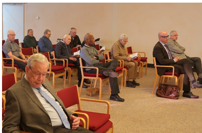
Viering in de kapel van Glorieux