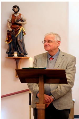
De algemeen overste